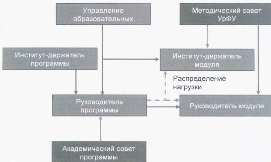
Рис. 2. Схема управления образовательной программой

Основные показатели развития образовательных программ и их значения, относительно которых осуществляется составление плана развития образовательной программы и оценка ее эффективности, устанавливаются ежегодно распоряжением директора по образовательной деятельности.